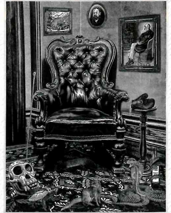
● 大賞 [KREFFT'S CHAIR] REW HANKS