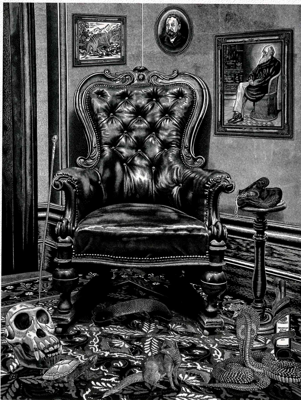
大賞 「KREFFT'S CHAIR」 REW HANKS

THE 9TH KOCHI INTERNATIONAL TRIENNIAL EXHIBITION OF PRINTS