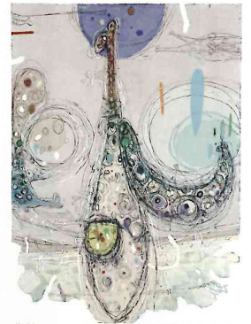
● 準大賞 [winds work - 59] 佐竹 邦子