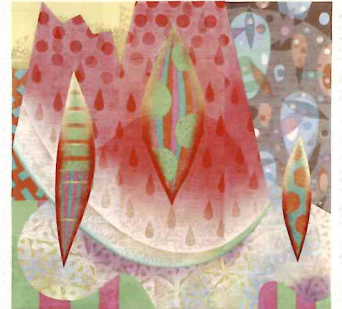
● 準大賞 [夏の果実(六)] 平木 美鶴